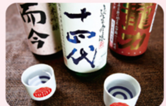
日本酒 (日本橋三四四会オリジナルぐい呑み付) 2杯 ¥1,000(3杯目以降 1杯 ¥400、3杯 ¥1,000)

このほかにも、文明堂カフェのパンケーキ、八重洲とよだのカニコロッケ、 肉鮮問屋佐々木のメンチカツ、玖子貴の薩摩揚げに 手造りハム工房レッカーピッセンの手作りソーセージ、JR東日本の駅弁など、 美味しさテンコ盛りでお待ちしています！※全て税込となります。