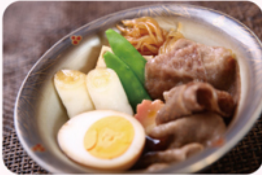
伊勢重 すき焼き盛り合わせ ¥800