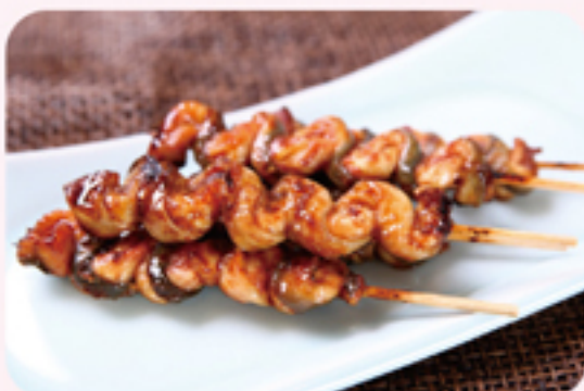
鯉チーム(うなぎ屋 大江戸・高輪家・いづもや・富代川) 鯉・くりから焼 ¥400