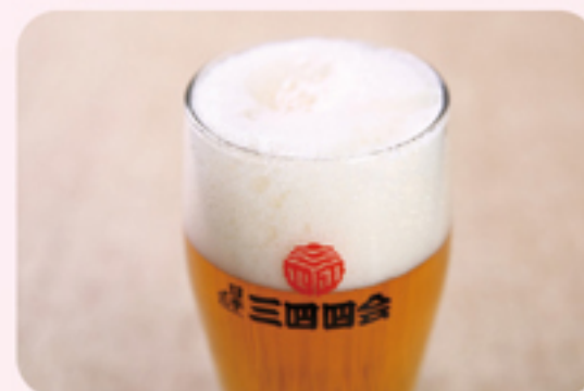
アサヒビール グラス付生ビール ¥500(2杯目以降 ¥400)