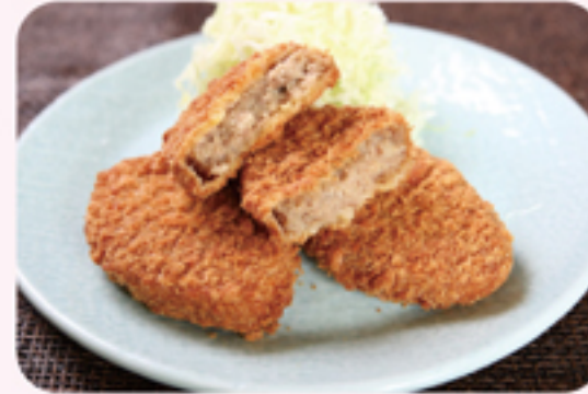
いけ増 飛騨牛コロッケ ¥200