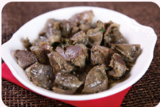
Vino e IL raccolta 砂肝のコンフィ ¥500