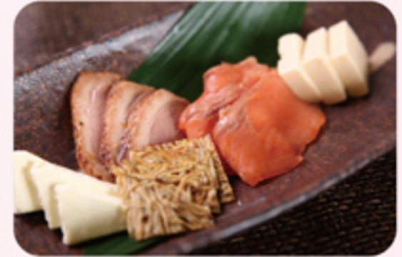
いけ増 生サーモン燻製のおつまみセット ¥800