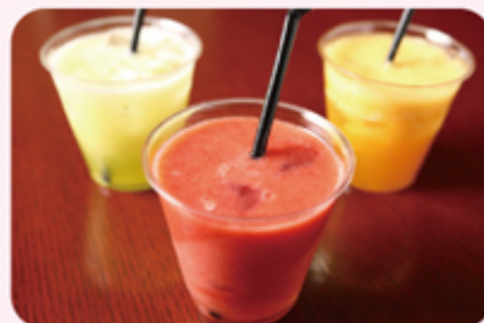
イマノフルーツファクトリー あまおうジュース、デコポンジュース ¥350