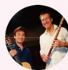
デキシーキッズ(ディキシーランド・ジャズ演奏)