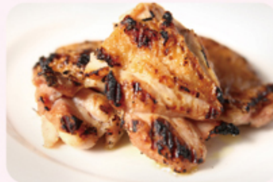
ピストロ サプリエ 炭火焼若鶏グリル ¥500