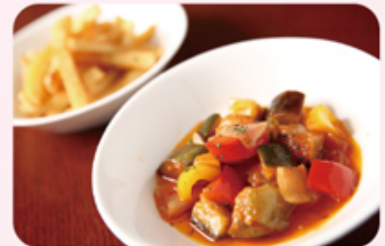
ピストロ サプリエ ラタトゥイユ ¥300