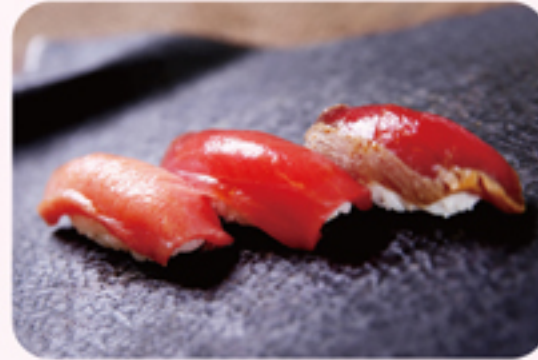
寿司チーム(吉野鮎本店・築乃齋・鮎の市本店・舟寿し・寿司良) まぐろにぎり 3貫 ¥1,000