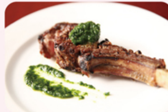
ピストロ サプリエ 炭火焼子羊 ¥500